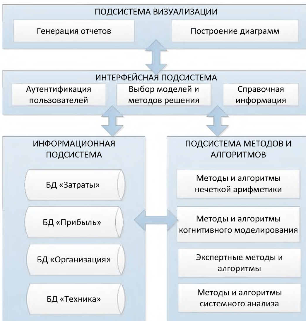
Рис. 3. Структурная схема СПИР «ИнвестИнфо»

Следовательно, определение суммарной стоимости затрат на реализацию ИТП позволит выполнить расчет наиболее значимых показателей экономической эффективности проекта для принятия обоснованного решения по его внедрению.