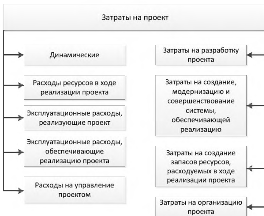
Рис.2. Схема затрат на реализацию ИТП в общем виде

Косвенные затраты обусловлены накладными расходами на содержание административно-управленческого аппарата проекта, НИИ, предприятий-изготовителей, на содержание, амортизацию, техническое обслуживание и ремонт оборудования и т.д.