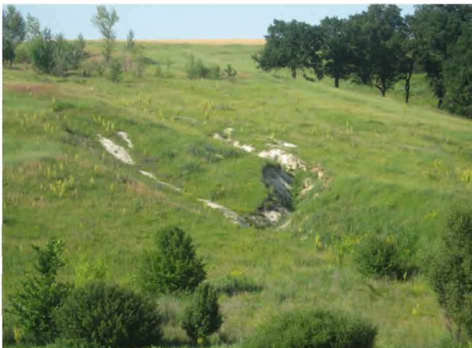
Рис. 2. Пример берегового оврага в Грайворонском районе Fig. 2. Example of a coastal ravine in Graivoronsky District

Наши исследования показывают, что на территории Белгородской области наблюдается три основных типа оврагов: береговые – прорезающие склоны берегов речной долины или склоны балок (рис. 2); склоновые – это овраги вышедшие за бровку склона берега или склона; донные – зародившиеся на днище балок.