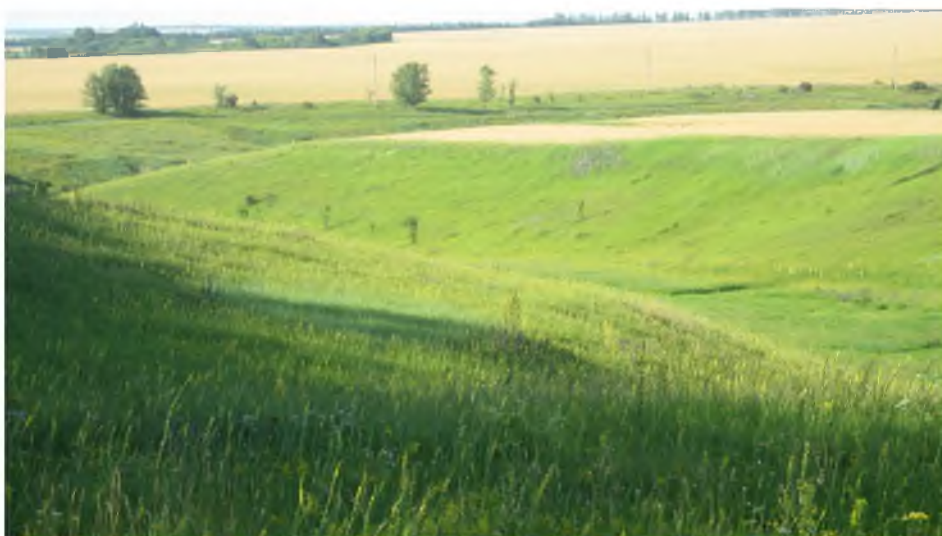
Рис. 1. Балка в Борисовском районе Fig. 1. The beam in the Borisovsky District

Активно развивающиеся овражно-балочные системы на территории Белгородской области создают сильно расчлененный рельеф и увеличивают уклоны земной поверхности, что приводит к активизации плоскостного смыва и линейного размыва. Склоны оврагов и балок зачастую активизируют и другие экзогенные процессы, такие как оползни, осыпи, карст, суффозия. В результате эрозионных процессов происходит как размывание горных пород вместе с почвами и их снос со склонов (денудация), так и их накопление на нижних уровнях рельефа (аккумуляция) [Хрисанов, 2000].