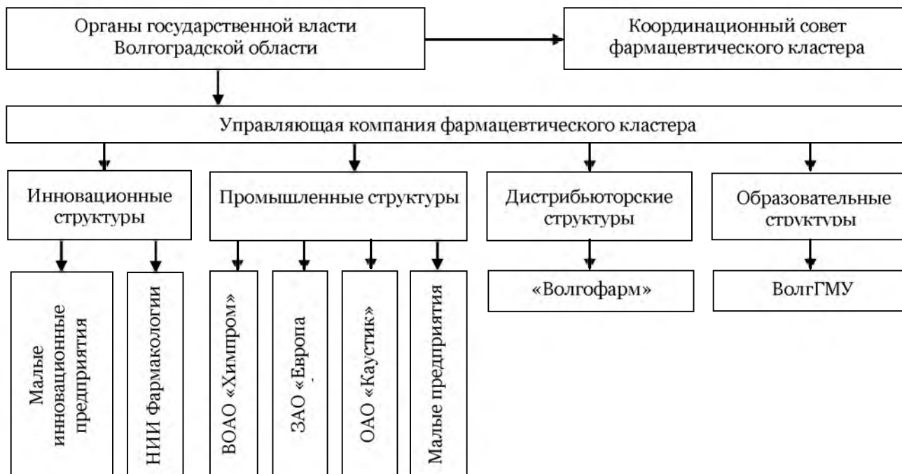
Рис.2. Общая схема координации деятельности участников фармацевтического кластера в Волгоградской области

Волгоградская область имеет все необходимые предпосылки для реализации столь масштабного проекта. Научной базой для фармацевтической отрасли является Волгоградский государственный медицинский университет, объединяющий для фармакологических и фармацевтических исследований потенциал научных учреждений региона – НИИ Фармакологии Волгоградского государственного медицинского университета, Волгоградский исследовательский медицинский центр Администрации Волгоградской области, Научно–исследовательский институт гигиены, токсикологии и профпатологии, Волгоградский научно-исследовательский противочумный институт Роспотребнадзора. Волгоградский государственный медицинский университет, кроме того, является ведущим учебным заведением региона, обеспечивающим профессиональными кадрами лечебные и фармацевтические учреждения.