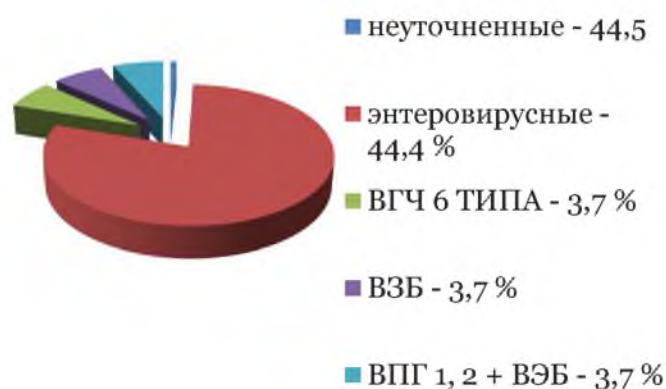
Рис. 1. Этиологическая структура серозных менингитов у детей в Белгородской области с 2011 по 2013 гг.

Среди уточненных серозных менингитов преобладают энтеровирусные 44,4%.