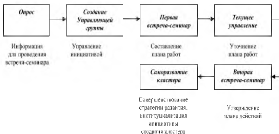
Рис. 2. Этапы создания локального туристского кластера в Кейличе

сформированы на базе пляжного туризма. Наиболее популярным и эффективным является Анталия. Следует особо заметить, что пляжные туристские кластеры формировались на основе системы комплексного обслуживания «Все включено», которая стала маркетинговой составляющей стратегии управления национальным турпродуктом [5].