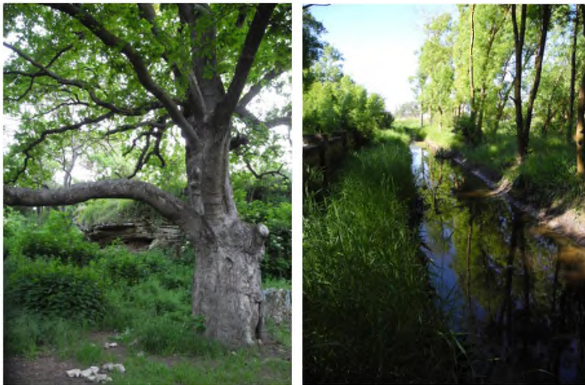
Рис. 1. Широколиственные породы с участием дуба в устье балки Кель-Шейх (Воронцовский парк, пгт. Черноморское)