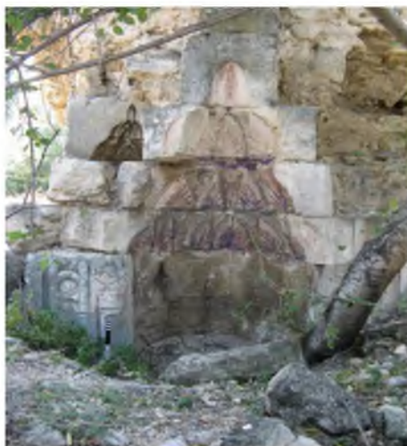
Рис. 1. Михраб. Вид с севера. 2012 г. Fig. 1. Mihrab. View from the north. 2012.

Несмотря на очевидную результативность предпринятых нами натурных и архивных изысканий, до сих пор нереализованным остаётся, пожалуй, наиболее перспективное их направление – изучение культурного слоя памятника. Наряду с уточнением всех известных сейчас сведений о мечети, её археологические раскопки способны дать исчерпывающие ответы на многие актуальные вопросы, лишь обозначенные, но пока оказавшиеся неразрешимыми посредством привлечения остальных, доступных на данном этапе исследований и представленных выше научных источников.