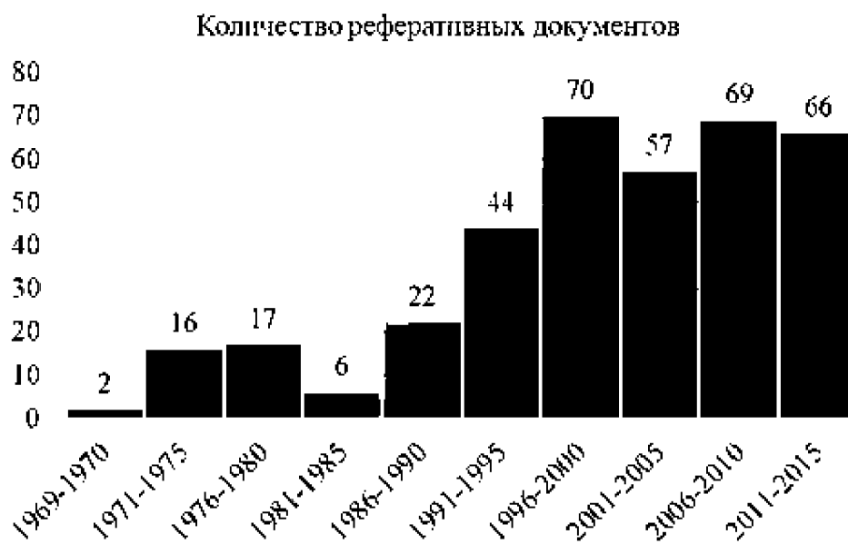
Рис. 1. Динамика распределения реферативных документов, классифицируемых по ключевым словам «phytoecdyson» и «phytoecdysteroid» за период с 1969 по 2015 гг.

Согласно данным РБД «SciVerse Scopus», общий объем реферативных документов, классифицируемых по ключевому слову «phytoecdyson» за период с 1969 по 2015 гг., достиг 53 единицы реферирования; по ключевому слову «phytoecdysteroid» с 1981 по 2015 гг. – 316. Таким образом, при дальнейших статистических анализах по данному классу веществ будет использоваться итоговое значение – 369. Распределение количества реферативных документов за данный период времени, как интегральный показатель научного интереса исследователей в динамике, представлен на рис. 1.