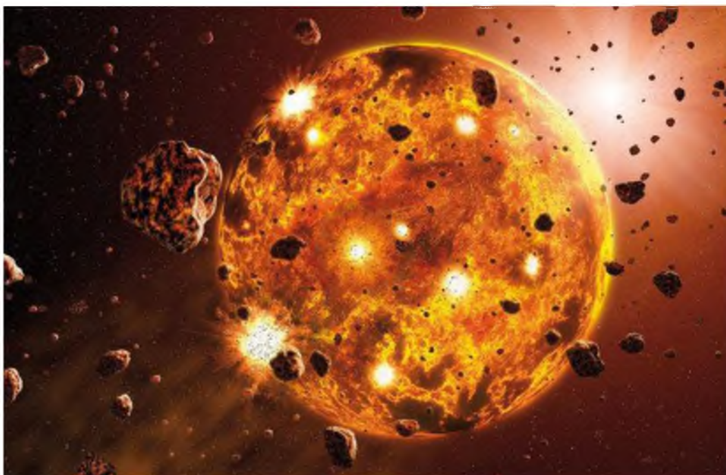
Рис. 1. Аккреция Земли в результате ее бомбардировки планетезималиями Fig. 1. Accretion of Earth as a result of her bombing of a planetezimals

Земля и другие планеты образовались из холодного газопылевого облака, температура которого в районе орбиты будущей Земли не превышала 100^{\circ}\text{C} . Процесс аккреции планет длился относительно короткое по геологическим масштабам время – от 10^7 до 10^8 лет. Однако, как во время, так и сразу же после аккреции существовали достаточно мощные источники тепловой энергии, которые привели к разогреву Земли. Начальный разогрев Земли был связан, прежде всего, с самим процессом аккреции, поскольку постепенное столкновение планетезималей, образующих планету, неизбежно должно было преобразовывать их кинетическую энергию в тепловую. На ранних стадиях аккреции сила притяжения «зародыша» планеты была небольшой и потому скорость и энергия ударов новых добавляющихся планетезималей была низка; однако с ростом планеты интенсивность ее гравитационного поля увеличивалась, а значит, возрастала и скорость падения планетезималей (рис. 1).