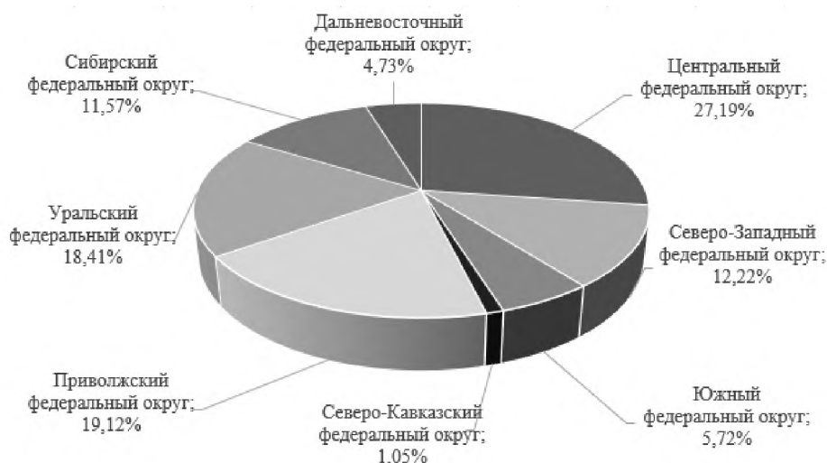
Рис.1. Структура промышленного производства по федеральным округам РФ в 2016 г., % к итогу Fig.1. The structure of industrial production in the federal districts of the Russian Federation in 2016, % of the total

С.А., 2015.]. Объем производства промышленной продукции в разрезе федеральных округов России распределяется следующим образом: наибольший удельный вес (около трети от общего объема промышленной продукции страны) приходится на Центральный федеральный округ, на втором месте – Приволжский федеральный округ, а на третьем – Уральский. Наименьший объем производства промышленной продукции зафиксирован в Северо-Кавказском Федеральном округе (около 1%) (см. рисунок 1).