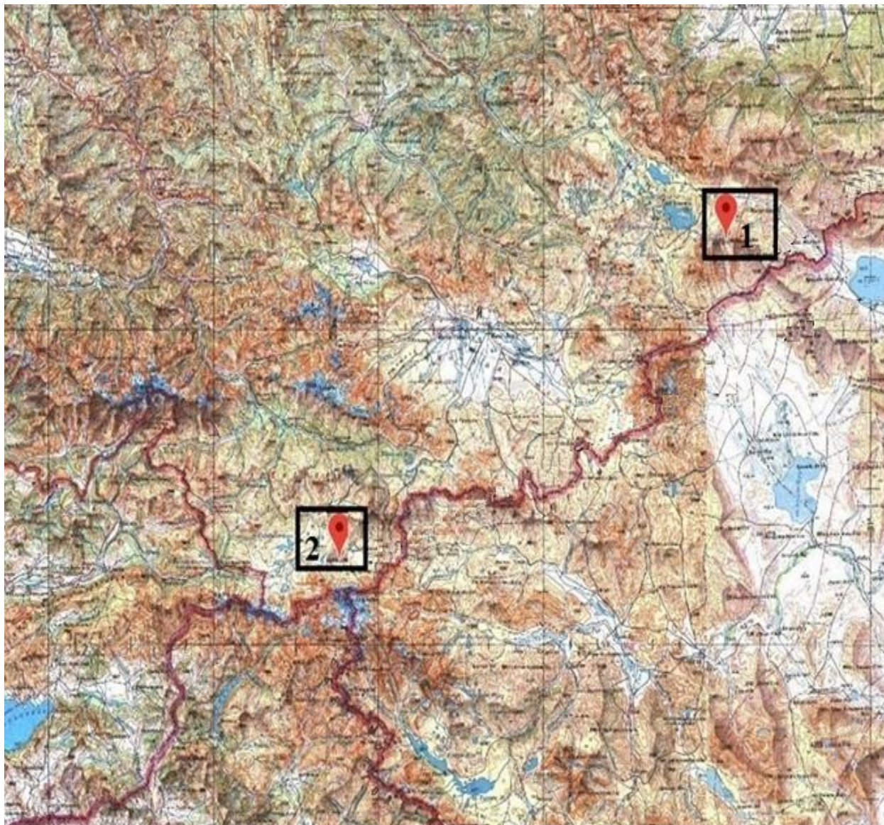
Рис. 1. Схема расположения районов исследования. Объекты: 1 – Юго-Западная Тува (Монгун-Тайга);

В качестве объектов исследований использовались горно-тундровые почвы Юго-Западной Тувы и Юго-Восточного Горного Алтая (рис. 1).