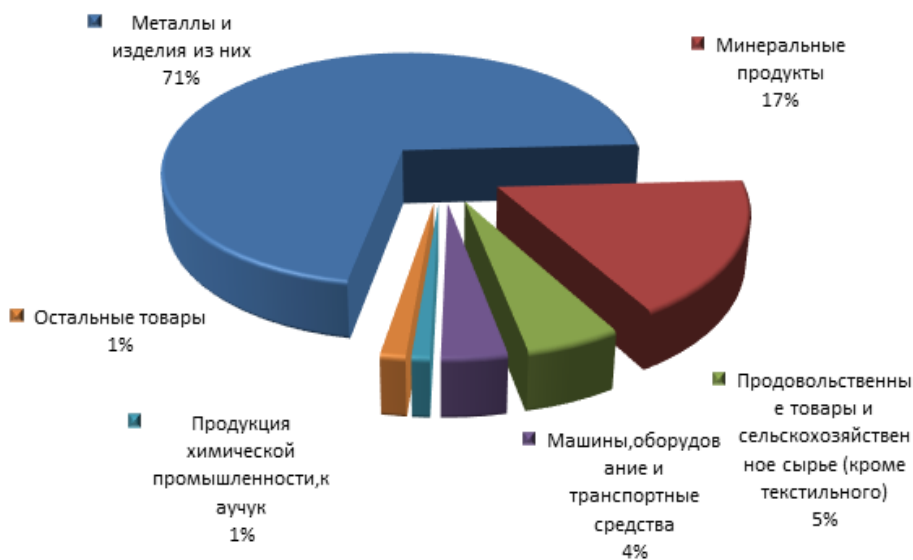
Рис. 2. Товарная структура экспорта Белгородской области Fig. 2. Commodity structure of export of the Belgorod region

Примером может служить Белгородская область, которая, как говорится, попала в тренд. Идею губернатора Е. Савченко по строительству 500 га теплиц сразу включили в программу импортозамещения. Позже список проектов расширился, и в 2016 году белгородское правительство заявило о реализации 86 инвестиционных проектов на общую сумму более 146 млрд руб., что во многом способствует развитию программы импортозамещения и является инновационным. Планируется запуск нового комбикормового завода, свиноводческих комплексов с использованием высокотехнологичного оборудования, а также завода по переработке подсолнечника, сои и рапса на основе инновационных технологий. Уже сегодня освоено 54,8 млрд руб., что повышает рейтинг Белгородской области по инвестиционной привлекательности региона. Помимо привлечения инвестиций, санкции оказали положительное влияние на сальдо внешней торговли области. Если раньше соотношение экспорта к импорту составляло 40/60, то теперь, наоборот, область экспортирует 60% от общего внешнеторгового оборота (рис. 2), а приобретает 40% продукции из-за рубежа (рис. 3).