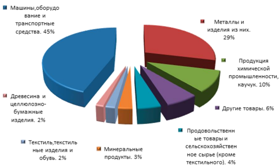
Рис. 3. Товарная структура импорта Белгородской области Fig. 3. Commodity structure of import of the Belgorod region