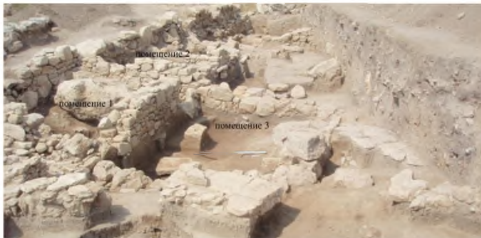
Рис. 2. Мирмекий-2009. Участок «ТС». Постройка 4: помещение 1, помещение 2, помещение 3 и вымостка. Вид с востока Fig. 2. Myrmekion-2009. Section «TS». Building 4: room 1, room 2, room 3 and the pavement. View from East