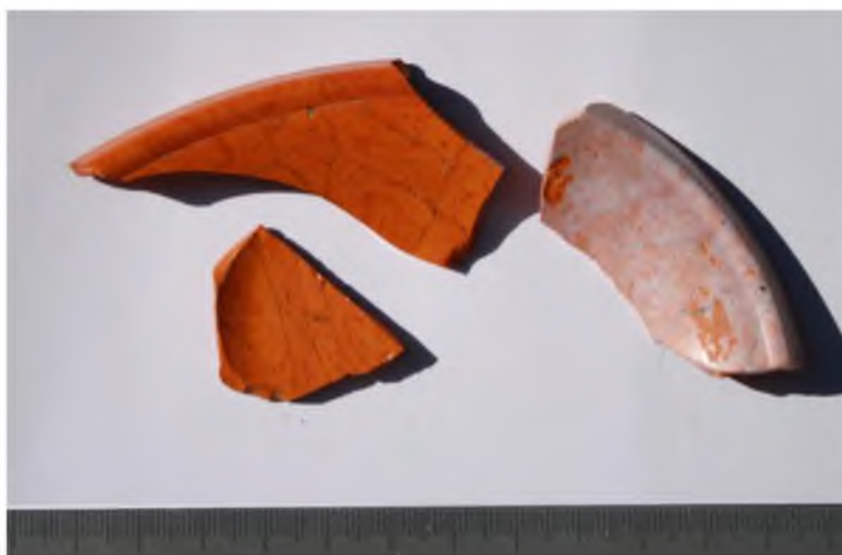
Рис. 6. Мирмекий-2009. Участок «ТС». Помещение 1.

Помещение 1. Фрагмент мраморной плитки Fig. 5. Myrmekion-2009. Section «TS». Room 1. Marble tile fragment