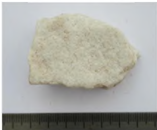
Рис. 4. Мирмекий-2009. Участок «ТС». Помещение 3, слой желтого суглинка.