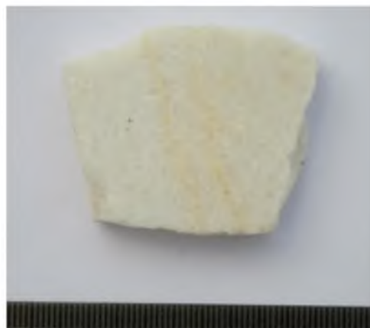
Рис. 5. Мирмекий-2009. Участок «ТС».

Помещение 1. Фрагмент мраморной плитки Fig. 5. Myrmekion-2009. Section «TS». Room 1. Marble tile fragment