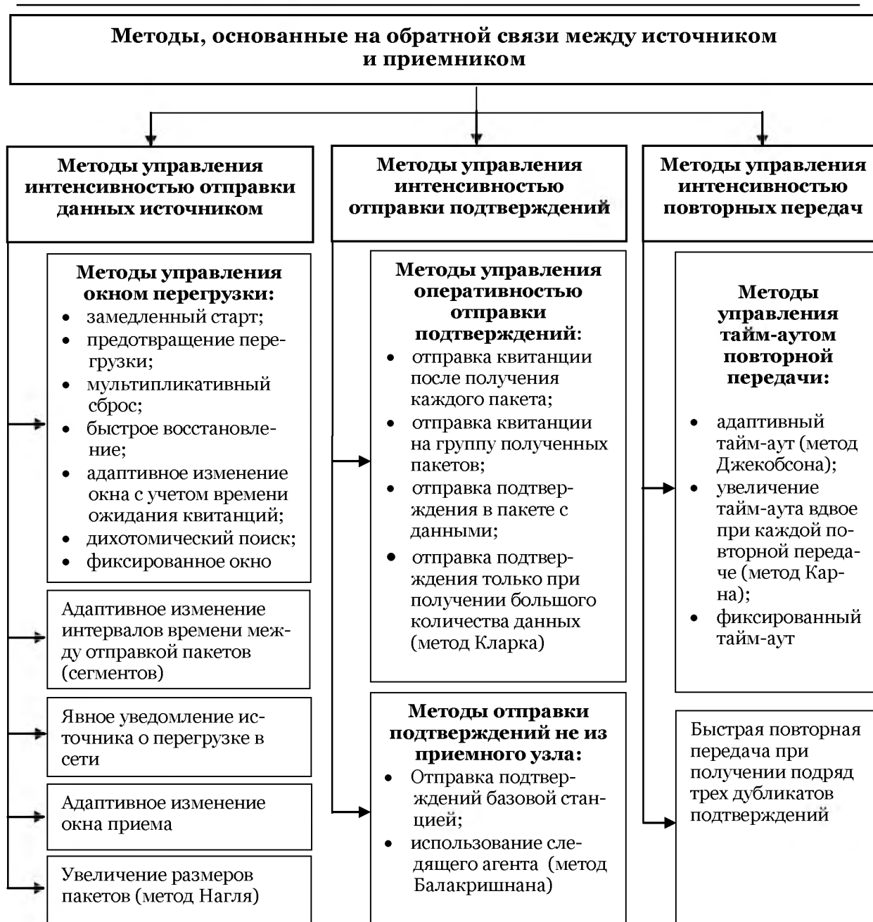
Рис. 2. Классификация методов обеспечения QoS, основанных на обратной связи между источником и приемником

Во всех указанных модификациях протокола TCP управление интенсивностью отправки сегментов осуществляется в соответствии с концепцией скользящего окна, которой присущи недостатки, связанные с интерпретацией потери сегмента как признака перегрузки в сети. В результате наблюдаются значительные пульсации циркулирующего в сети трафика. Это приводит к возникновению и усилению сетевых перегрузок, увеличения количества потерянных сегментов, которое влечет за собой замедление процесса передачи данных.