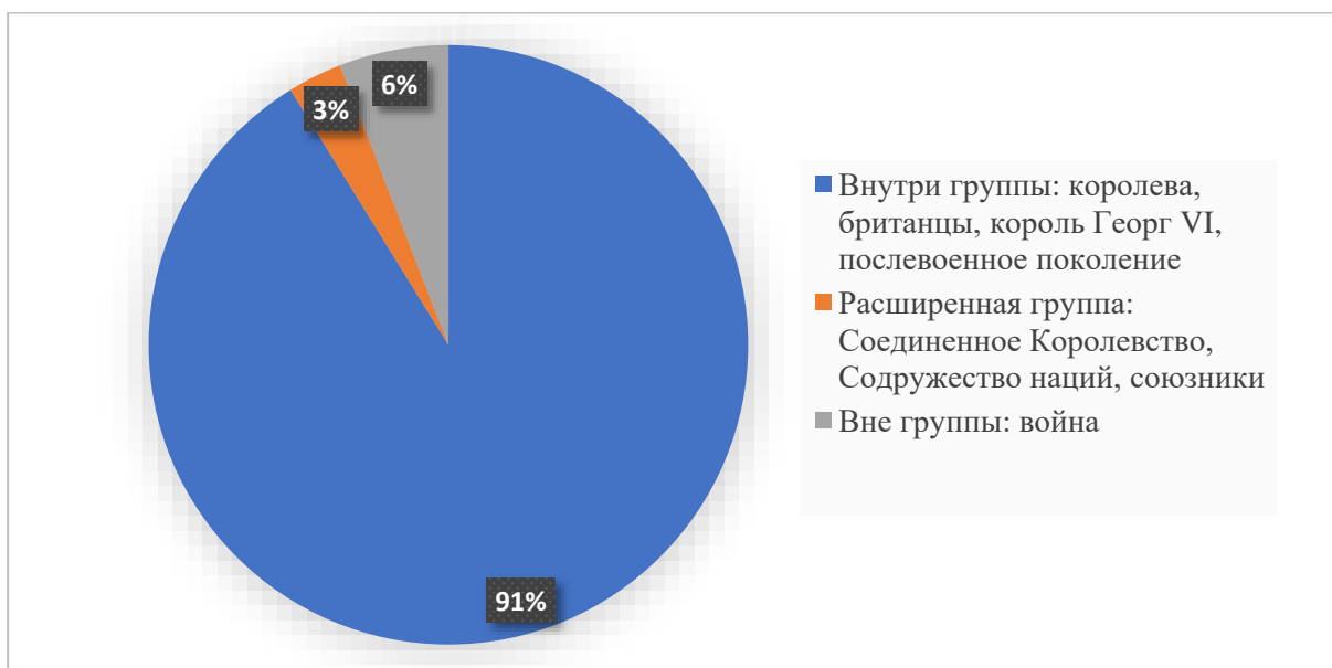
Рисунок 2. Частотность обозначения акторов в обращении королевы Елизаветы II Figure 2. Frequency of social actors in The Queen's address

Чаще всего в речи королевы употребляется местоимение «we» (двенадцать раз) в значении «британцы» («And when I look at our country today, and see what we are willing to do to protect and support one another...» 19 ), а также «послевоенное поколение» («They fought so we could live in peace, at home and abroad 20 »), «народы» («They died so we could live as free people in a world of free nations 21 »). Таким образом, в своей речи королева относит себя не исключительно к группе «британцы», но ко всему послевоенному мировому сообществу. Ценностно ориентированное употребление местоимения «we» в значении «народы, свободные нации», направлено на объединение.