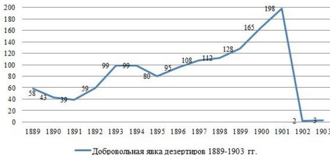
Рис. 2. Количество добровольно явившихся дезертиров на территории Курской губернии (чел.) Fig. 2. Number of voluntary deserters on the territory of Kursk province (persons)

Согласно анализу статистических данных по уездам Курской губернии, мужчины в возрасте от 25 до 30 лет (рождённые до 1893 года) игнорировали мобилизацию, и средний процент «уклонистов» колебался от 60 % до 70 % от общего числа призывников. Следует отметить, что мобилизованные мужчины, рождённые до 1893 года, как правило, уже имели собственное хозяйство и семью, которую необходимо было обеспечивать. Именно это обстоятельство обуславливало наибольший процент «уклонистов» в этой категории лиц призывного возраста. С другой стороны, мужчины, рождённые после 1895 года, давали самую массовую мобилизацию – 88,4 %. Как правило, это были не успевшие обзавестись семьей молодые люди, возраст которых колебался от 19 до 21 года [Раков, 2011]. Следует подчеркнуть, что именно мобилизованные данного возраста активно принимали участие в «добровольной явке» в случае дезертирства. Например, проводимая «добровольная явка» с 10 декабря 1920 года по 23 февраля 1921 года составила 711 человек от 1 326 мобилизованных или 53,6 % от общего количества призывников в обозначенных нами в статье 3-х уездах Курской губернии 77 (см. рис. 2).