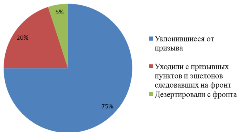
Рис. 1. Количество дезертиров в РККА на 29 мая 1918 г. (в % от общего числа военнослужащих)

По подсчетам Т.В. Осиповой, количество дезертиров в 1918 г. увеличилось в разы после принятия нескольких декретов СНК о введении на территории РСФСР продовольственной диктатуры: Декрета от 9 мая 1918 г. «О предоставлении Народному Комиссариату Продовольствия чрезвычайных полномочий по борьбе с деревенской буржуазией, укрывающей хлебные запасы и спекулирующей ими» 74 ; Декрета от 13 мая 1918 г. «О чрезвычайных полномочиях Народного Комиссариата по Продовольствию» 75 и Декрета от 27 мая 1918 г. «О реорганизации Народного Комиссариата Продовольствия и местных продовольственных органов» 76 . К этому времени около свыше 75 % призывников уклонились от призыва (см. рис. 1.) [Осипова, 2001, с. 302].