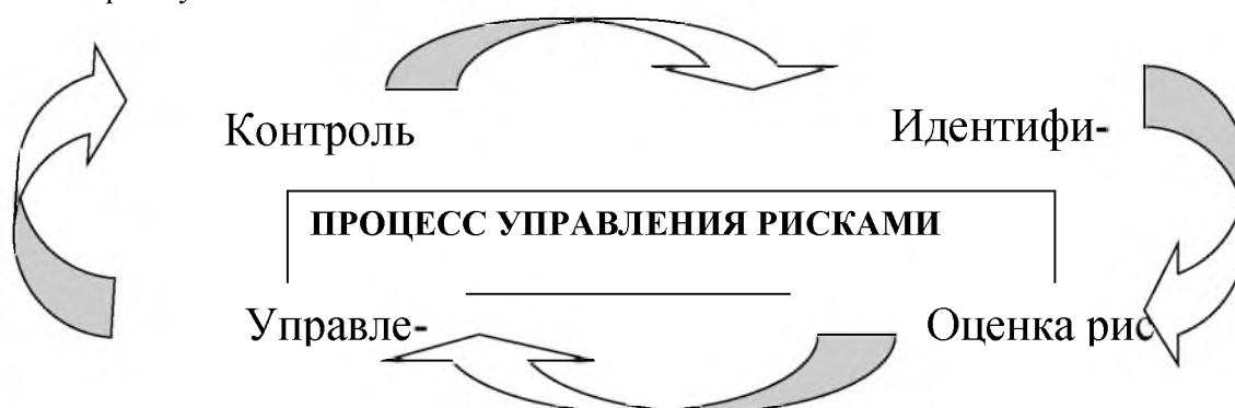
Рис. 2. Процесс управления рисками Fig. 2. Risk management process

Система управления рисками должна обеспечивать раннее распознавание и управление рисками, которые угрожают успеху компании и, в частности, ее дальнейшему существованию. Именно это намерение системы отражено в процессе управления рисками. Этот процесс состоит из четырех фаз, которые циклически взаимосвязаны между собой (рис. 2).