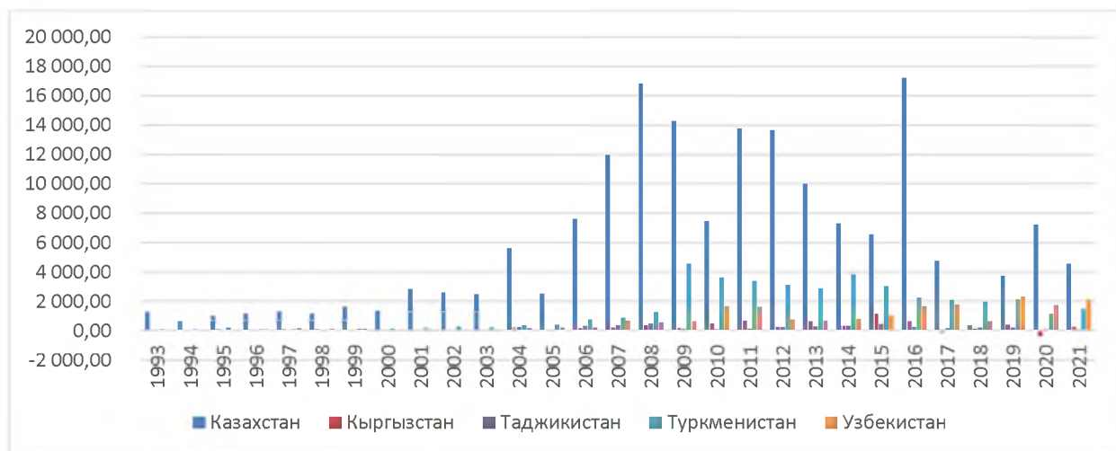
Рис. 3. Динамика инвестиций в страны ЦА, млн.долл.

Страны Центральной Азии сегодня развиваются очень быстро, прогнозируется рост ВВП в 2023 году в среднем по региону превышающий 6%, однако это развитие – следствие эффектов низкой базы, а также активного притока инвестиций из стран-основных игроков в регионе. Обратим внимание на рисунок 3, отражающий динамику ПИИ в ЦА в целом.