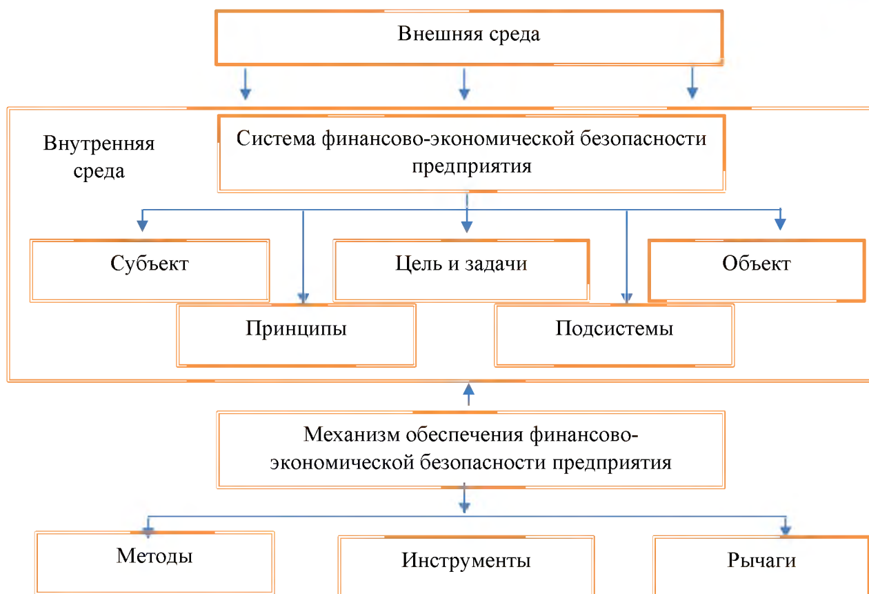
Рис. 1. Система обеспечения финансово-экономической безопасности сельскохозяйственного предприятия в условиях цифровизации Fig. 1. The system for ensuring financial and economic security of an agricultural enterprise in the context of digitalization

На уровень финансово-экономической безопасности влияют внутренние и внешние факторы. К внешним факторам относят политические, нормативно-правовое ограничение, конъюнктуру рынка, стратегию развития власти, величину банковских ставок, инвестиционную активность и другие. Основными внутренними факторами являются технологии, инновации, потенциал персонала, уровень инвестиционной активности [Biliomistniy, O., Bilomistna, I., & Galushko, Y., 2017].