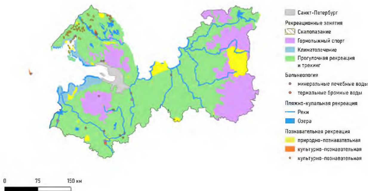
Рис. 2. Первичное рекреационно-геоморфологическое районирование

Промежуточный итог работы представлен на рис. 2 в виде первичного рекреационно-геоморфологического районирования. Первичность данного районирования заключается в следующем аспекте: не учтены территории пересечения выделенных на местности рекреационных занятий. Каждый слой, созданный в геоинформационной системе и представленный в легенде, представляет собой пространственную информацию по одному рекреационному занятию, а именно полигоны и точки с наиболее удовлетворяющими геоморфологическими условиями. Следовательно, возникает вопрос создания мультиполигонов, сочетающих в себе несколько типов и подтипов рекреационных занятий, а также вопрос приоритезации: для какой из нескольких рекреационных систем здесь представлены наилучшие условия.