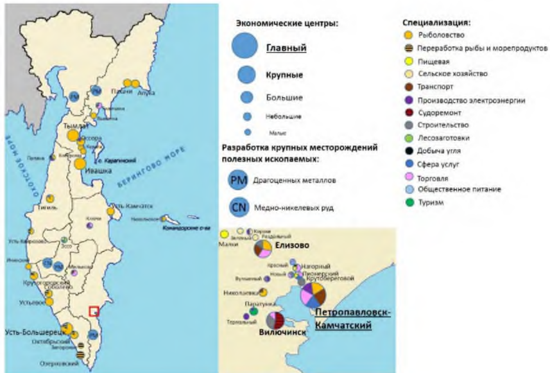
Рис. 4. Экономические центры Камчатского края и их специализация Fig. 4. Economic centers of the Kamchatka Territory and their specialization

По своим статистическим показателям район относится к высокоразвитым [Ушаков, 2022], но здесь нет ни одного экономического центра регионального уровня. Причина кроется в том, что на территории района активно развивается добыча драгоценных металлов, а крупные предприятия, которые разрабатывают месторождения, действуют далеко за пределами населенных пунктов. В результате этого возникают такие коллизии в оценке социально-экономического развития района и его поселений.