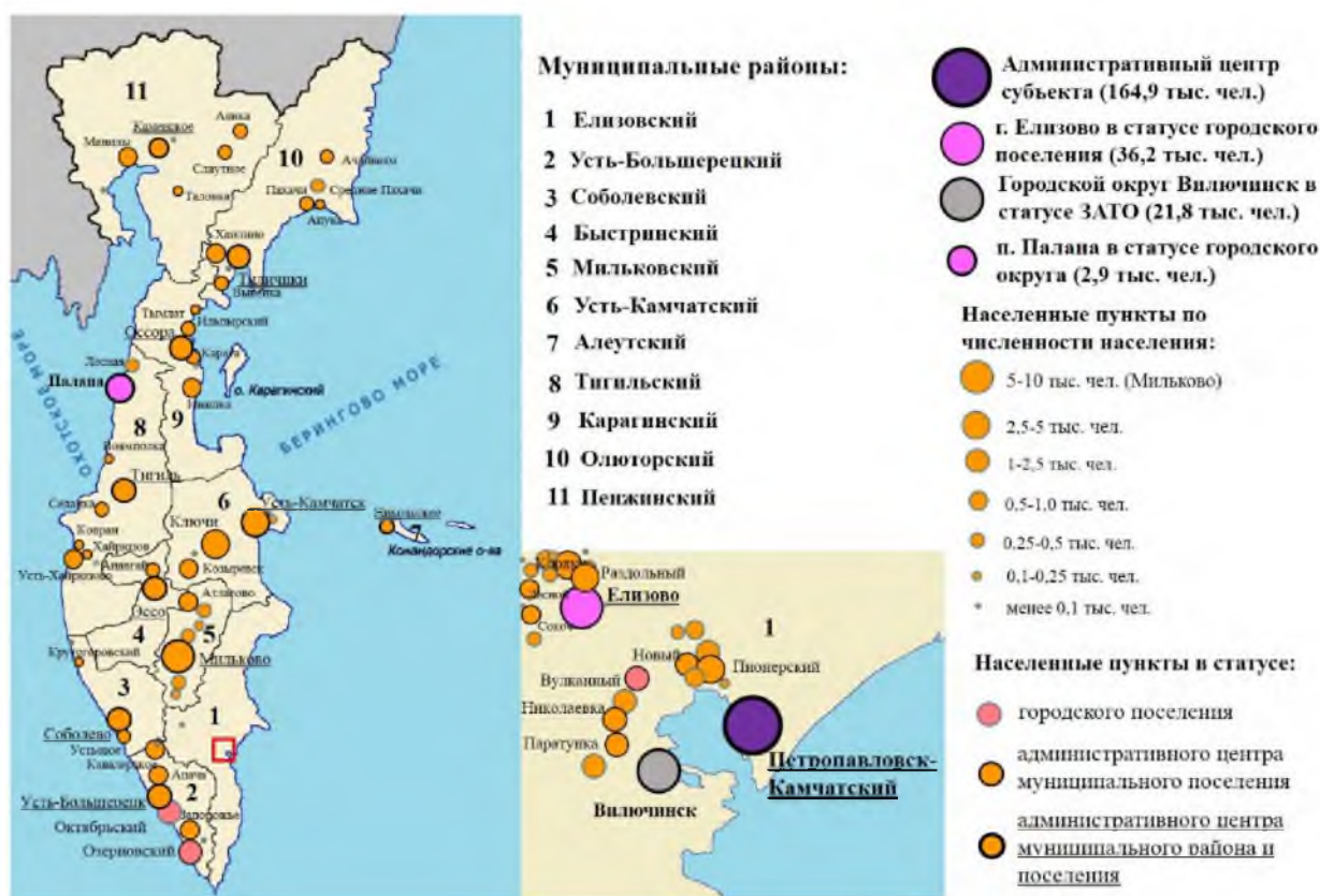
Рис. 1. Характеристика населенных пунктов в зависимости от численности их населения и административной статусности Fig. 1. Characteristics of settlements depending on their population and administrative status

Для этого были взяты поселения Камчатского края с целью изучения факторов, влияющих на развитие поселений, расположенных на территории слабоосвоенного региона, и их потенциала.