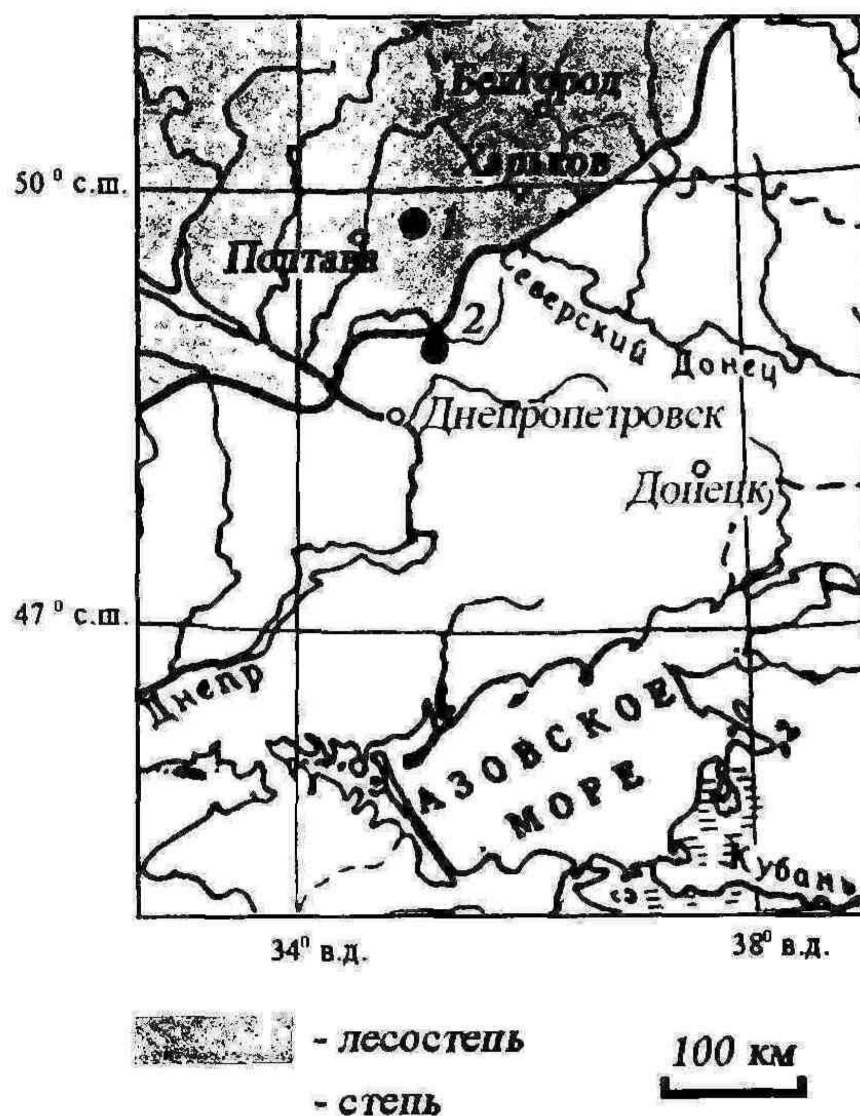
Рис. 1. Местоположение ключевых участков исследования позднеголоценовой эволюции черноземов: 1 — лесостепь (участок «Сторожевое»), 2 — степь (Богдановка, Чернявщина, Шандровка (Иванов, 1992))

Хроноряд черноземов, изученных на участке «Сторожевое», представлен в табл. 1. Согласно результатам проведенного исследования, в течение последних 3900 лет естественной истории в черноземах типичных наблюдался трендовый рост мощности гумусовых профилей и глубины залегания карбонатов. Наблюдаемые тенденции соответствуют общепринятым представлениям о закономерных изменениях во времени морфологического облика профилей черноземов в связи с позднеголоценовым увлажнением климата. Однако при сравнении с ходом эволюционного развития степных черноземов, изученных И. В. Ивановым [2] в 120 км к югу-юго-востоку от участка «Сторожевое» (рис. 1), выявляются региональные отличия (табл. 1, 2).