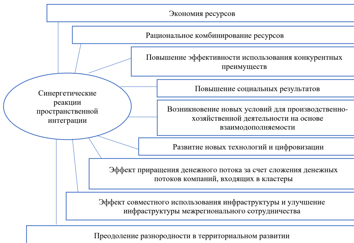
Рис. 3. Синергетические реакции пространственной интеграции (составлено на основе [Владыка, Чистникова, Ермаченко, 2020]) Fig. 3. Synergistic reactions of spatial integration (compiled on the basis of [Vladyka, Chistnikova, Ermachenko, 2020])