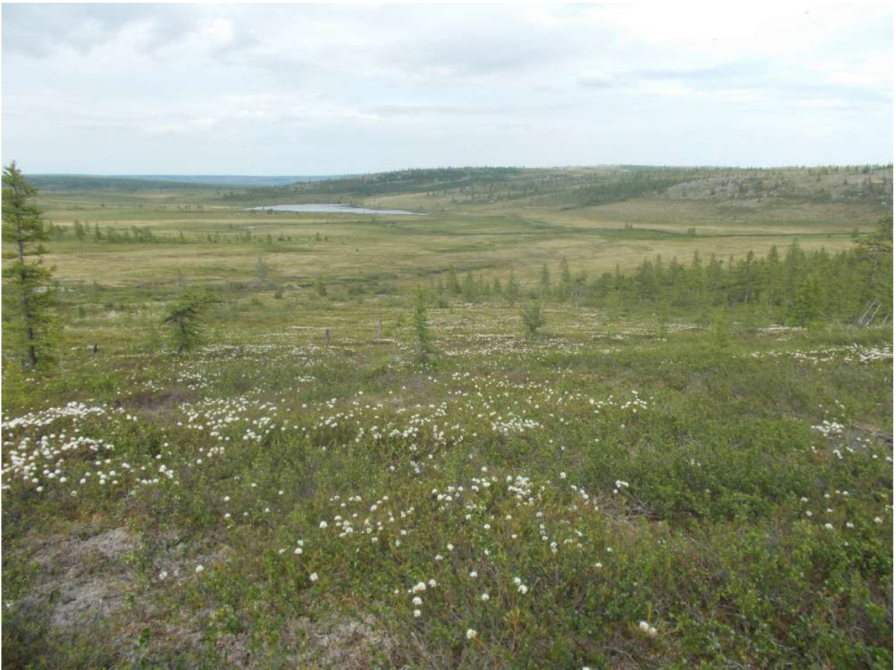
Рис. 1. Вид на долину реки Париквасьшор (Приуральский район, Ямало-Ненецкий АО), лето 2018 года (фотография С.Н. Плюснина)

Фактический материал для работы собран авторами этой статьи летом 2018 года во время полевых работ в подзоне лесотундры в Приуральском районе Ямало-Ненецкого автономного округа (ЯНАО), преимущественно в бассейне реки Париквасьшор (рис. 1), относящейся к Нижнеобскому бассейновому округу (подбассейн – бассейны притоков Оби ниже впадения Северной Сосьвы). Для уточнения отдельных аспектов морфологии растений также привлечён гербарный материал фондов цифрового гербария Московского государственного университета им. М.В. Ломоносова (Москва, MW) [Seregin, 2024].