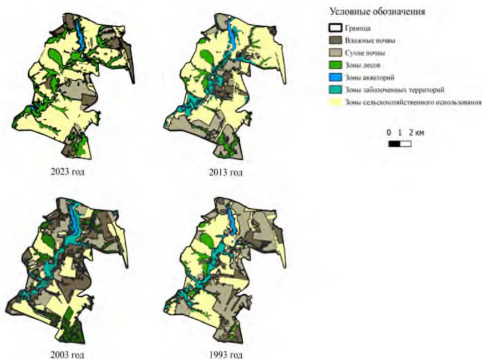
Рис. 3. Трансформация функциональных зон Быковского сельского поселения в период 1993–2023 гг.

В 2023 году преобладающим типом на всей территории Быковского сельского поселения остается геоэкологическая система сельскохозяйственного типа. Количество заболоченных территорий из-за зарастания сократилось до минимума. Выявлено, что за последние 30 лет в рамках геоэкологических систем происходит плавное преобразование функциональных зон поселения. Особенности этого процесса за 30 лет наблюдений отражены на рис. 3.