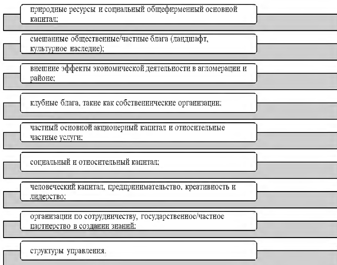
Рисунок 2 – Составляющие территориального капитала

Рассматривая приведенную интерпретацию, можно отметить, что территориальный капитал содержит следующие составляющие (рисунок 2).