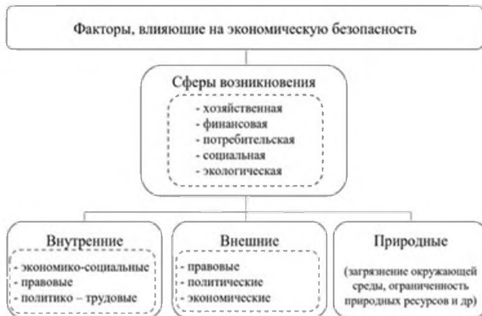
Рисунок 4 – Факторы экономической безопасности [6, 4678]

Если рассматривать факторы, которые влияют на экономическую безопасность, то следует акцентировать внимание на том, что они между собой неразрывно связаны (рисунок 4).