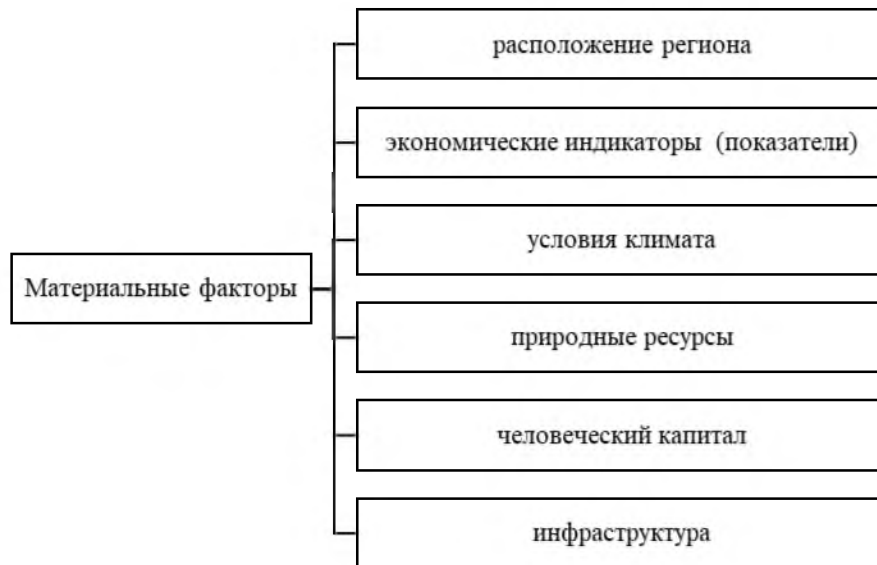
Рисунок 3 – Факторы материальной формы территориального капитала

Нематериальные активы, в свою очередь, могут быть представлены категорией социального капитала, объединяющий в себе комплекс индивидуальных особенностей, которые позволяют сформировать среду для конкурентного развития, а также включает в себя взаимодействие субъектов разных направлений, в частности власти, бизнеса и других социальных объектов [4, с. 3594].