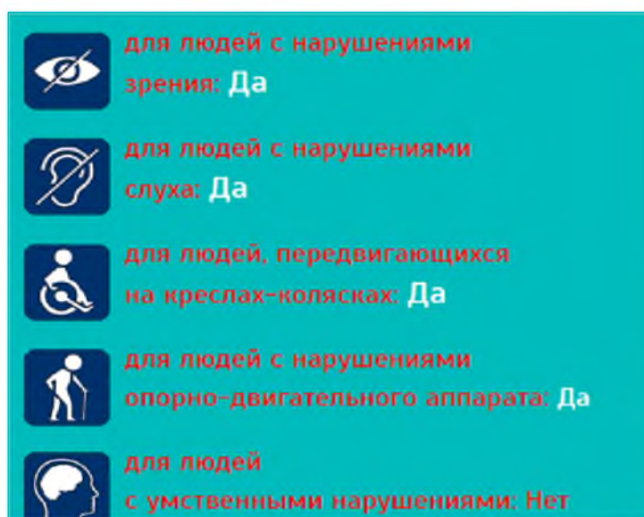
Рис. 2. Доступность ЦСА для различных категорий граждан по данным интерактивной карты Fig. 2. Availability of the CA for various categories of citizens according to the interactive map

Согласно данным карты, ЦСА доступен для людей с нарушением зрения, слуха, опорно-двигательного аппарата, но недоступен для людей с умственными нарушениями (рис. 2). Информация о том, в чем заключается недоступность для этой категории, в данных об учреждении отсутствует.