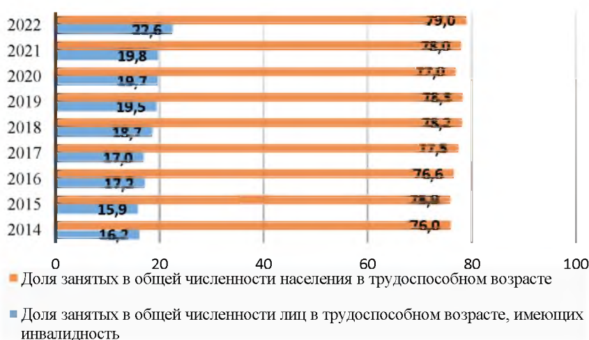
Рис 5. Показатели занятости лиц в трудоспособном возрасте, имеющих инвалидность (в %) Figure 5. Employment rates of working age persons with disabilities (%)

Уровень материального положения граждан, имеющих статус инвалида, остается ниже среднего. По данным Министерства социальной защиты и труда Приднестровской Молдавской Республики, минимальный размер пенсии для инвалидов I и II группы на 1 февраля 2023 г. составляет 727 руб. 65 коп., для инвалидов III группы 363 руб. 82 коп., в то время как прожиточный минимум в среднем на душу населения составляет 1861 рубль. Из