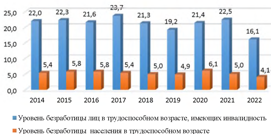
Рис 4. Показатели безработицы лиц в трудоспособном возрасте, имеющих инвалидность (в %) Figure 4. Unemployment rates of working age persons with disabilities (%)

По данным Федеральной службы государственной статистики России, уровень безработицы лиц в трудоспособном возрасте (Рис.4), имеющих инвалидность, уже почти десятилетие значительно выше, чем у основной категории населения; также устойчива тенденция: увеличение доли занятых среди данной категории, в сравнительном анализе с долей занятости в общей численности населения трудоспособного возраста, не наблюдается (Рис.5) [Федеральная служба государственной статистики]. Стоит отметить, что низкий уровень занятости исследуемой категории объясняется тем, что число квотируемых для людей с ограниченными возможностями мест составляет примерно 1/10 часть от потребности.