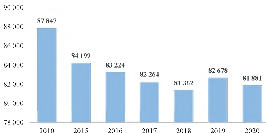
Рис 2. Численность населения в трудоспособном возрасте на территории Российской Федерации, тыс. человек