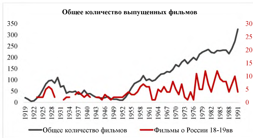
Рис. 1. Советские художественные фильмы. График выхода фильмов по годам

и запрещенных или утраченных. Так, установлено, что с 1919 по 1991 гг. снято и выпущено 7 850 художественных фильмов (рис. 1).