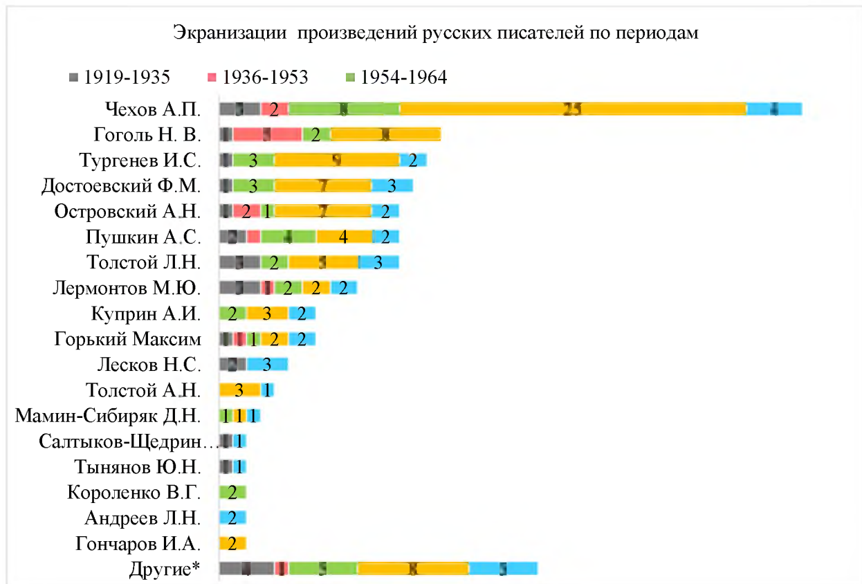
Рис. 3. Количество экранизаций произведений русских писателей по периодам

Выделено 23 писателя, у которых экранизировано только одно произведение, что составило 12 % от 195 исследуемых экранизаций (рис. 3). Наибольшее количество таких экранизаций (8) пришлось на период с 1965 по 1984 г.