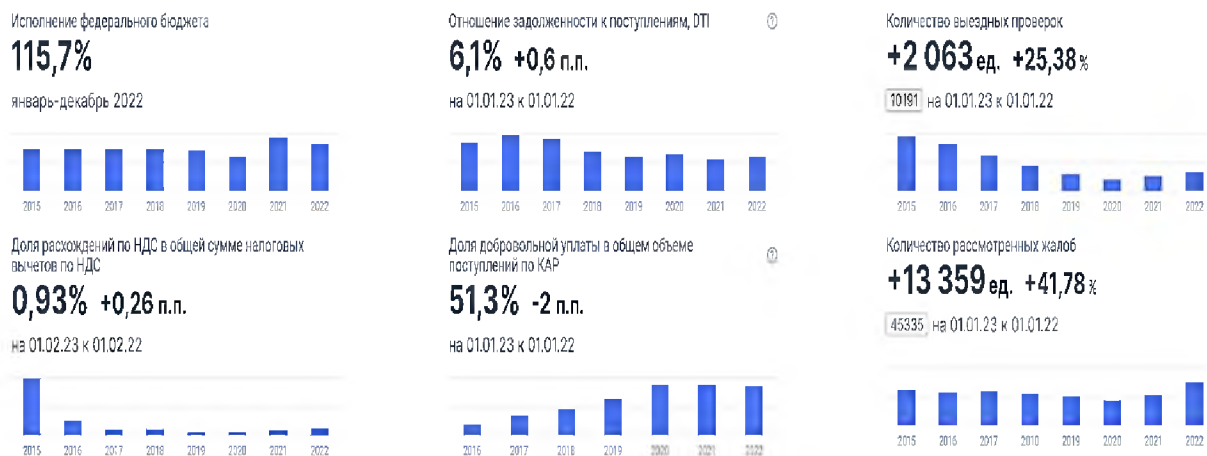
Рис. 2 – Индикаторы российской налоговой системы за 2022 г. [1]

Следует отметить, что, хотя цифровизация имеет множество преимуществ, остаются проблемы, в том числе связанные с управлением изменениями, возможностями реализации, базовой сложностью налоговой системы (правил и устаревших систем) и наличием необходимого законодательства, чтобы идти в ногу с цифровыми достижениями. Однако данные проблемы являются несущественными по сравнению с теми возможностями, которые открывает цифровизация как для налогоплательщиков, так и для представителей налоговых органов.