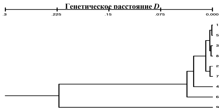
Рис. 3. Дендрограмма генетических расстояний по Nei [10] (UPGMA)

В заключение была рассчитана эффективная численность исследуемых групп улиток. Она определялась по формуле, учитывающей уровень инбридинга в популяции [12]: