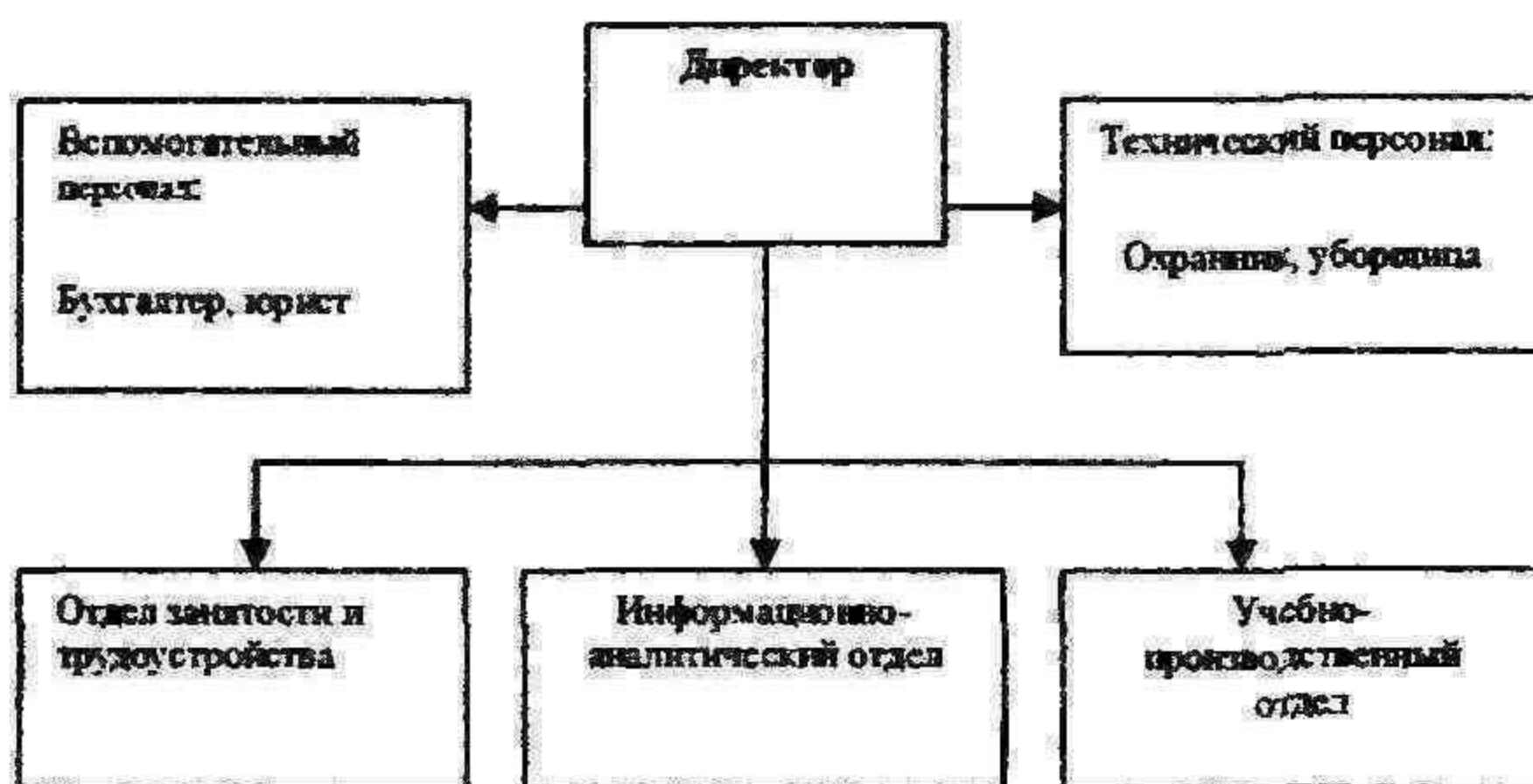
Рис. 2. Организационная структура молодёжной биржи труда

Для более эффективной реализации функций молодёжной биржи предполагается создать организационную структуру, представленную на рис. 2.